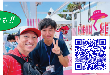
1週間で10万再生を超えたTikTok動画↑